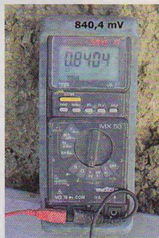
Mesure avant branchement.